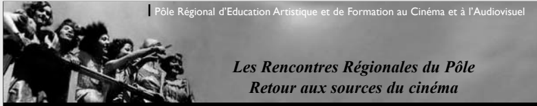
Pôle Régional d'Education Artistique et de Formation au Cinéma et à l'Audiovisuel