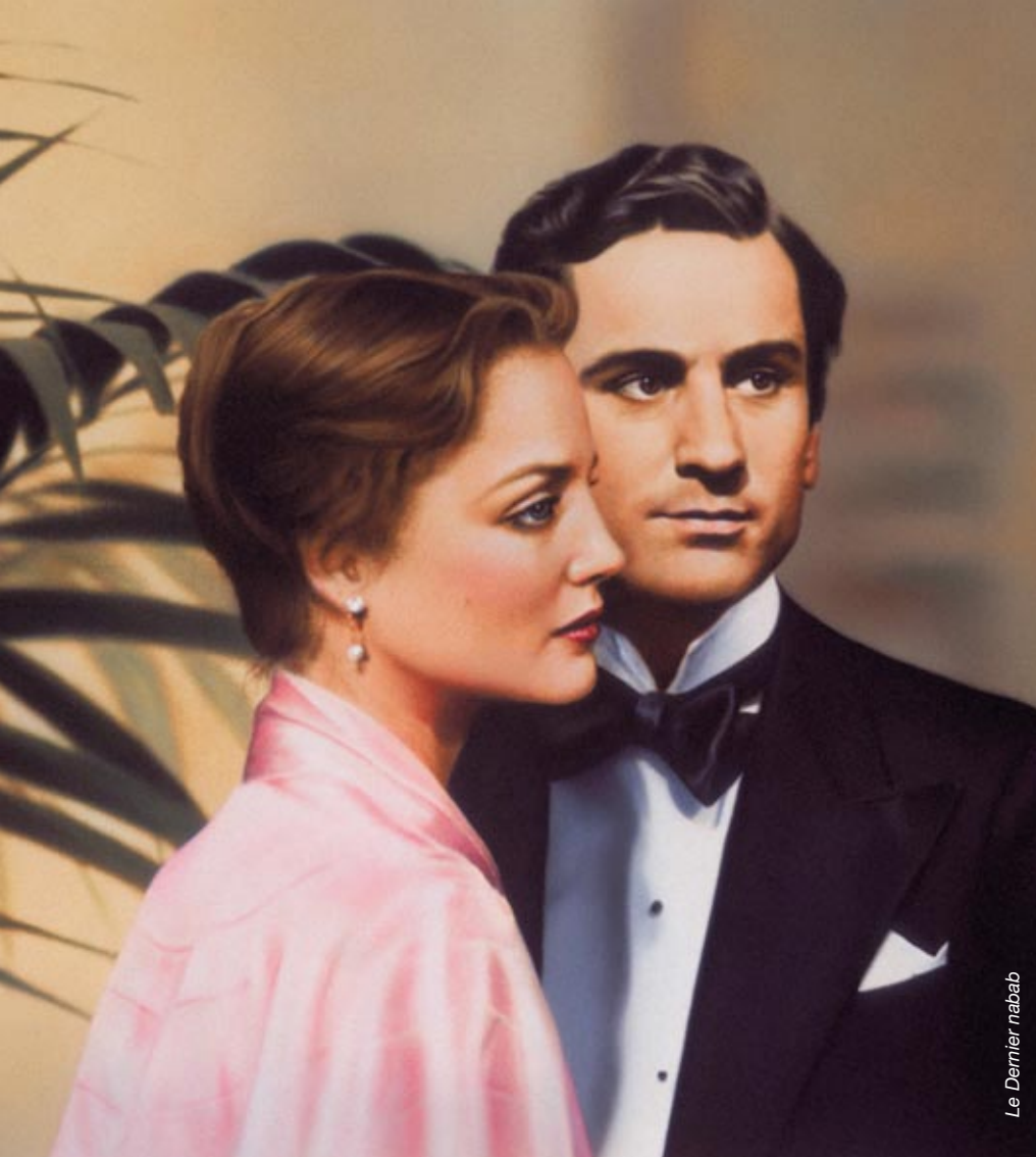
Le Dernier nabab