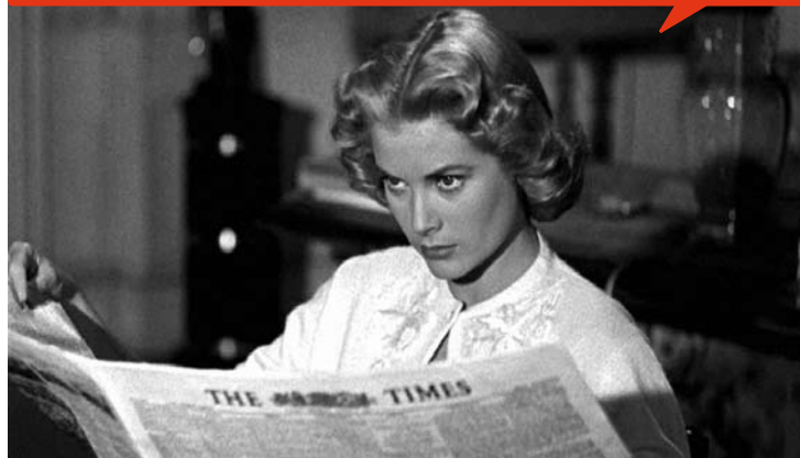
Le Crime était presque parfait