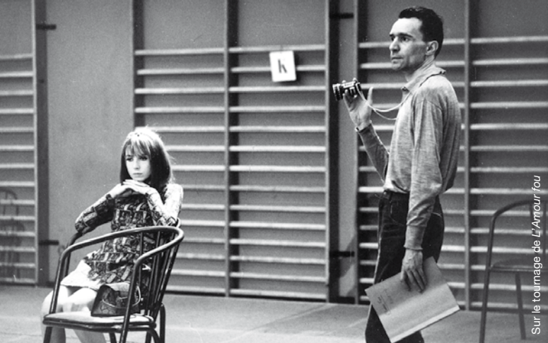
Sur le tournage de L'Amour fou