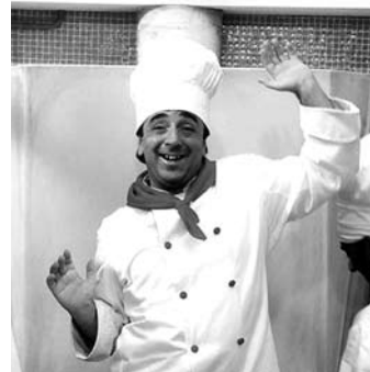
Aprile de Nanni Moretti

..... Notre carte de fidélité , ..... en vente au prix de 15 €, est valable de septembre à septembre. Elle donne droit : - au tarif de 3 € - à l'accès aux cours de cinéma du mardi - au tarif de 7,50 € au CinéMazarin et au Renoir (sauf week-end et jours fériés)