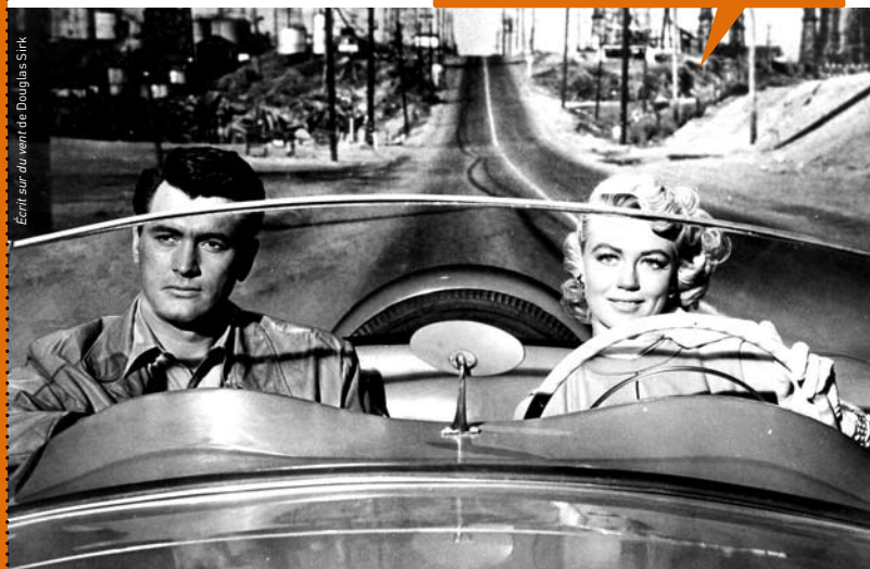
Écrit sur du verre de Douglas Sirk