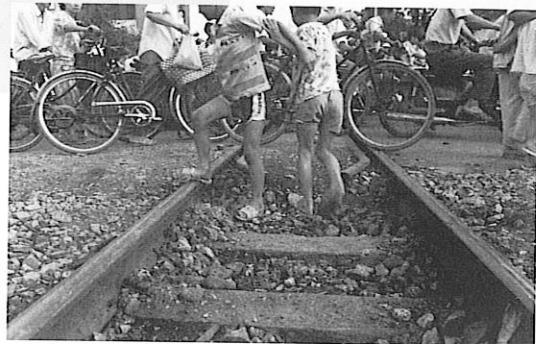
Point de départ

Film présenté par Gilles de Gantès le mardi 18 février à 20 h 15.