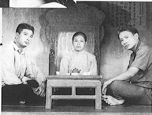
Parti, parti, parti pour toujours