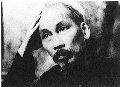
Hồ Chí Minh dans 79 primaveras , film de Santiago Alvarez (1969)