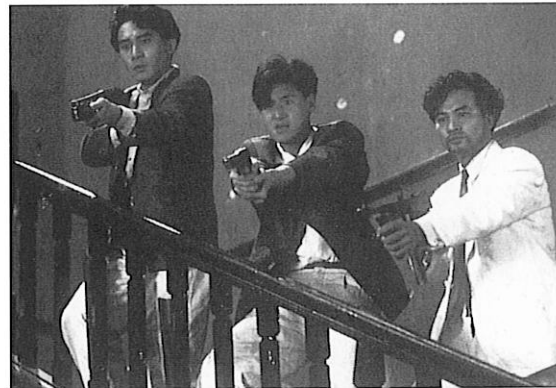
Une balle dans la tête

► Trois amis inséparables quittent Hong-Kong et partent à l'aventure au Vietnam, pendant la guerre. L'un d'eux a une obsession : devenir riche. Il trahira ses amis pour arriver à ses fins. Une balle dans la tête est une fresque intime et historique, nourrie d'influences tant occidentales qu'asiatiques. L'un des grands films de John Woo.