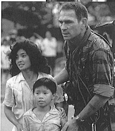
Entre ciel et terre