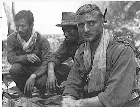
La 317 e section

Film présenté par Jérôme Kanapa le dimanche 2 mars à 14 h 30.