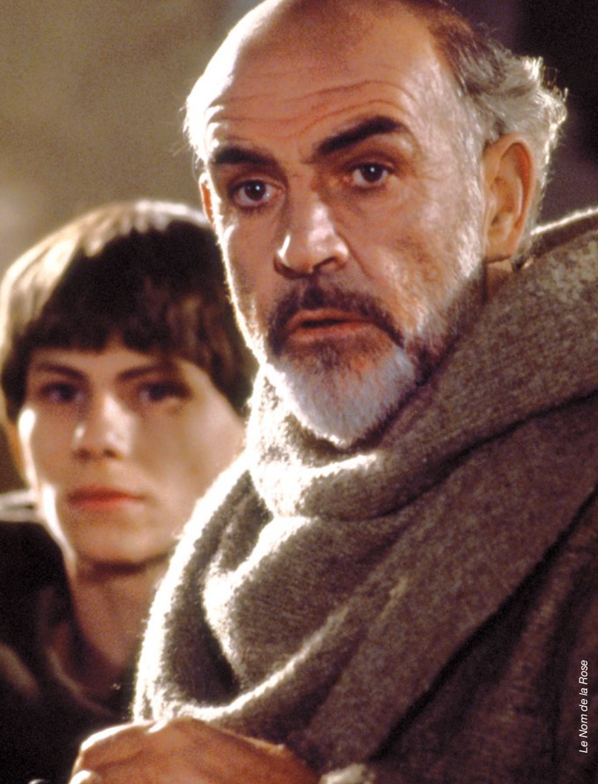
Le Norm de la Rose