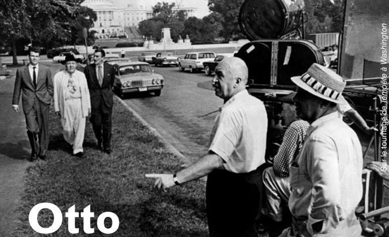
Sur le tournage de Tempête à Washington