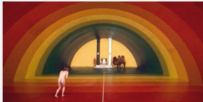
La Montagne sacrée