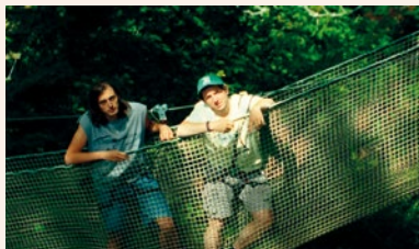
Nous les singes

L'Institut de l'image participe à la fête du court métrage avec un programme de 6 films qui vont titiller vos zygomatiques :