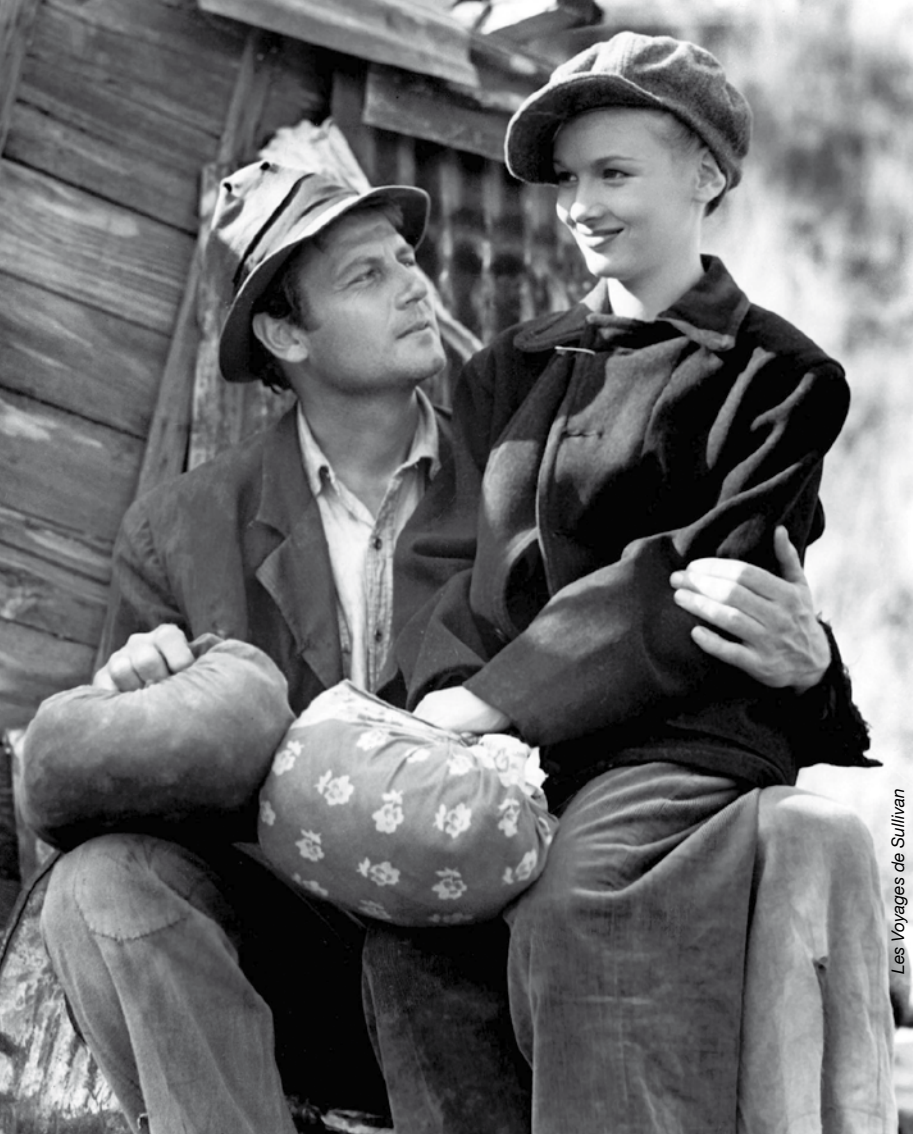
Les Voyages de Sullivan