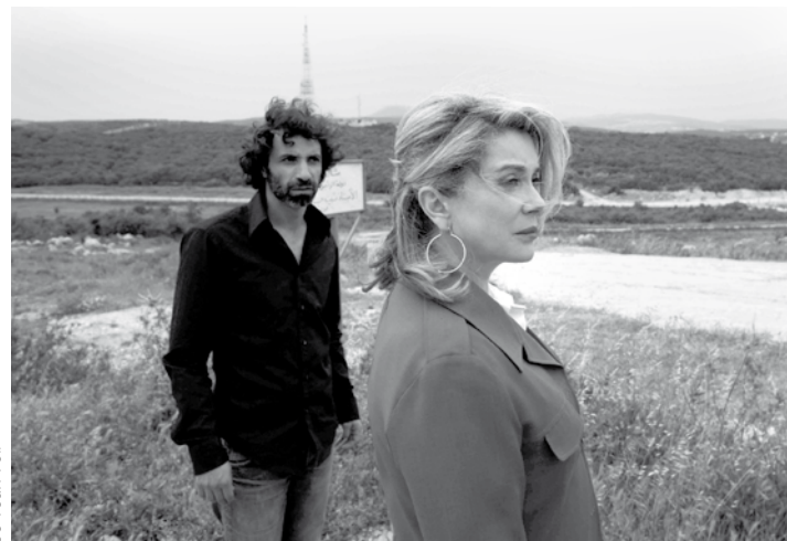
Je veux voir

TIRANA (Fr./All., 2012 – 26 min) de Alexander Schellow en présence de Flavie Pinatel, Alexander Schellow et Jean-Laurent Csinidis, producteur (entrée libre)