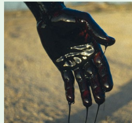
My Name is oil