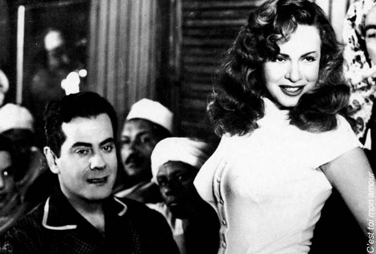
C'est toi mon amour