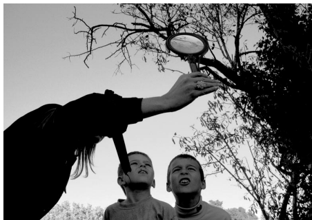
Atelier Lumière, photographie et paysage, S. Frémot et D. Comtat – École de Rognes